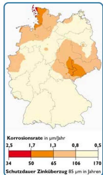
Modifizierte Zinkkorrosionskarte der Bundesrepublik Deutschland

Dadurch sind Sie schon jetzt für die Zukunft gerüstet und wir können Ihnen ein zuverlässiges und zukunftsweisendes Schornsteinsystem bieten – unsere zuverlässige Lösung für industrielle Anwendungen im Baukastenprinzip.